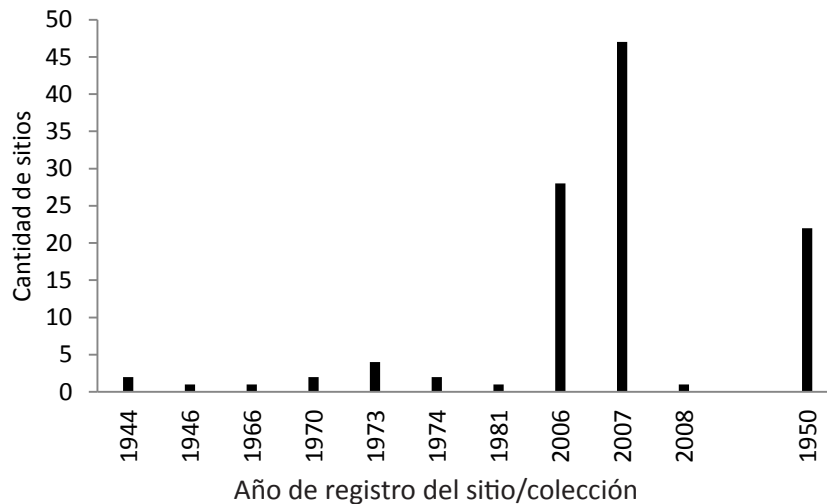
Figura 6.11.2. Cantidad de sitios arqueológicos investigados de acuerdo al año (Pocho).

A ello se suman otros sitios investigados por Serrano (1944), A. Romero (1970) y una colección del MdA de la que aun no se conocen las localizaciones originales de los sitios.